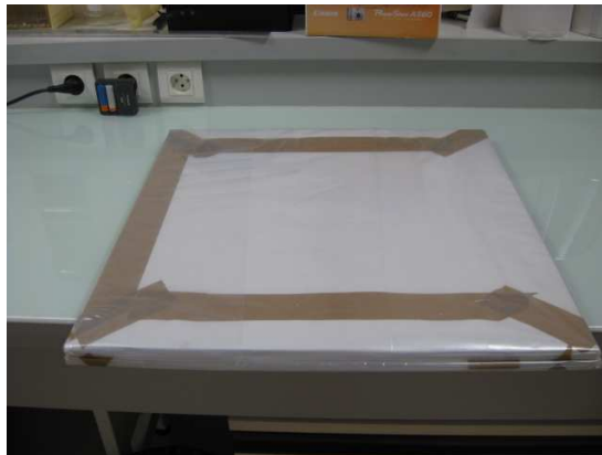
Photo 1 : Echantillon 10/1143C/1 à réception / Sample 10/1143C/1 at reception